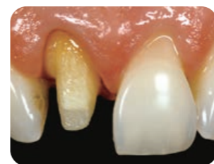
オールセラミック【術前】