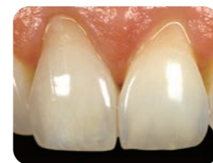
オールセラミック【術後】