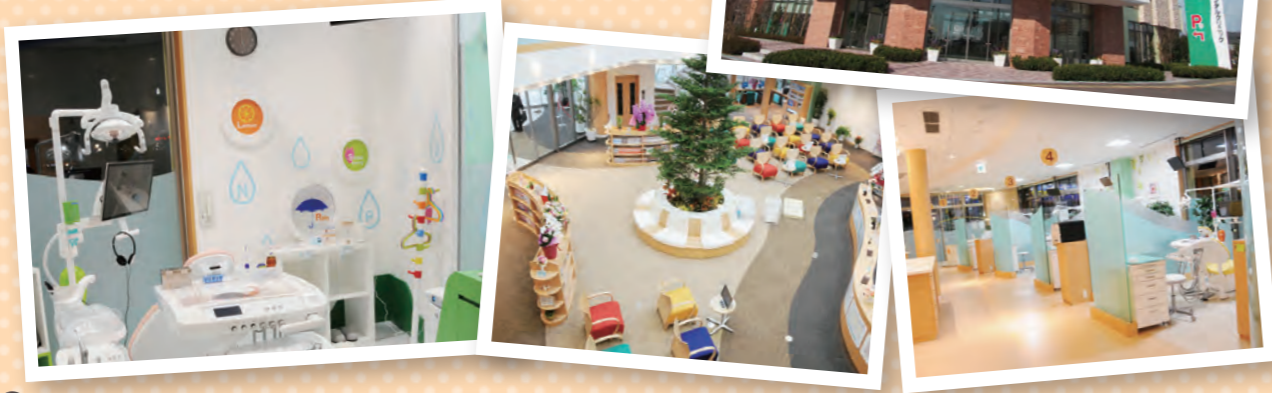
※歯科医師2名、歯科衛生士3名、歯科助手10名、 歯科受付3名で対応しております。

http://www.tokushinkai.or.jp/clinic/nagamachi/