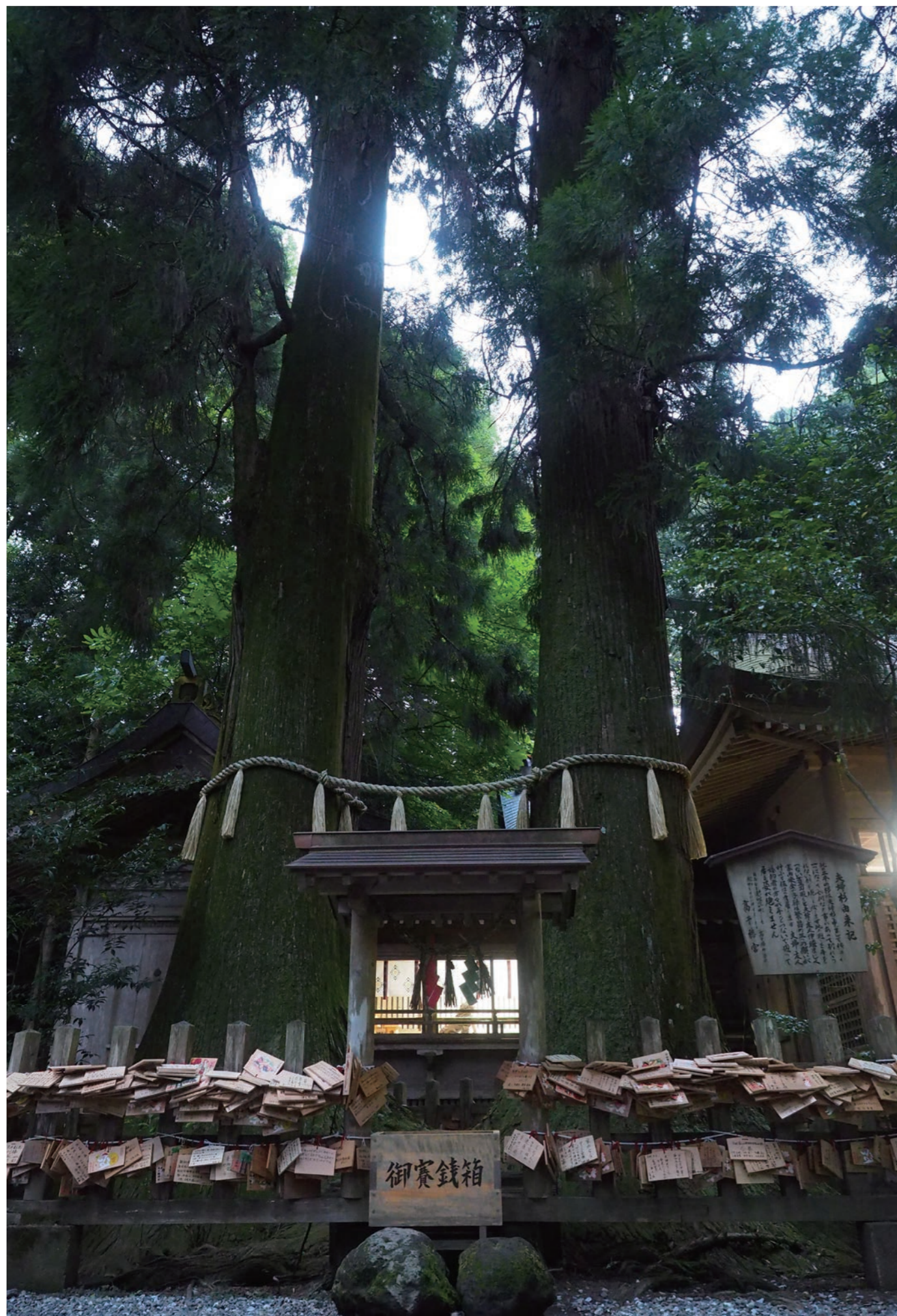
撮影場所：宮崎県西臼杵郡高千穂町

今年「丁酉」の年です。 丁は「火の弟」とも書き、火の性質を持っていると言われています。 また酉は五行で見ると金（金属）の性質、つまり今年火と金の組合せとなります。 火は金を溶かし、火が金を相剋すると言い、これは、順調ではないという意味にもなります。 今年自分の力を過信する事なく慎重にやる事が大切な年の様です。