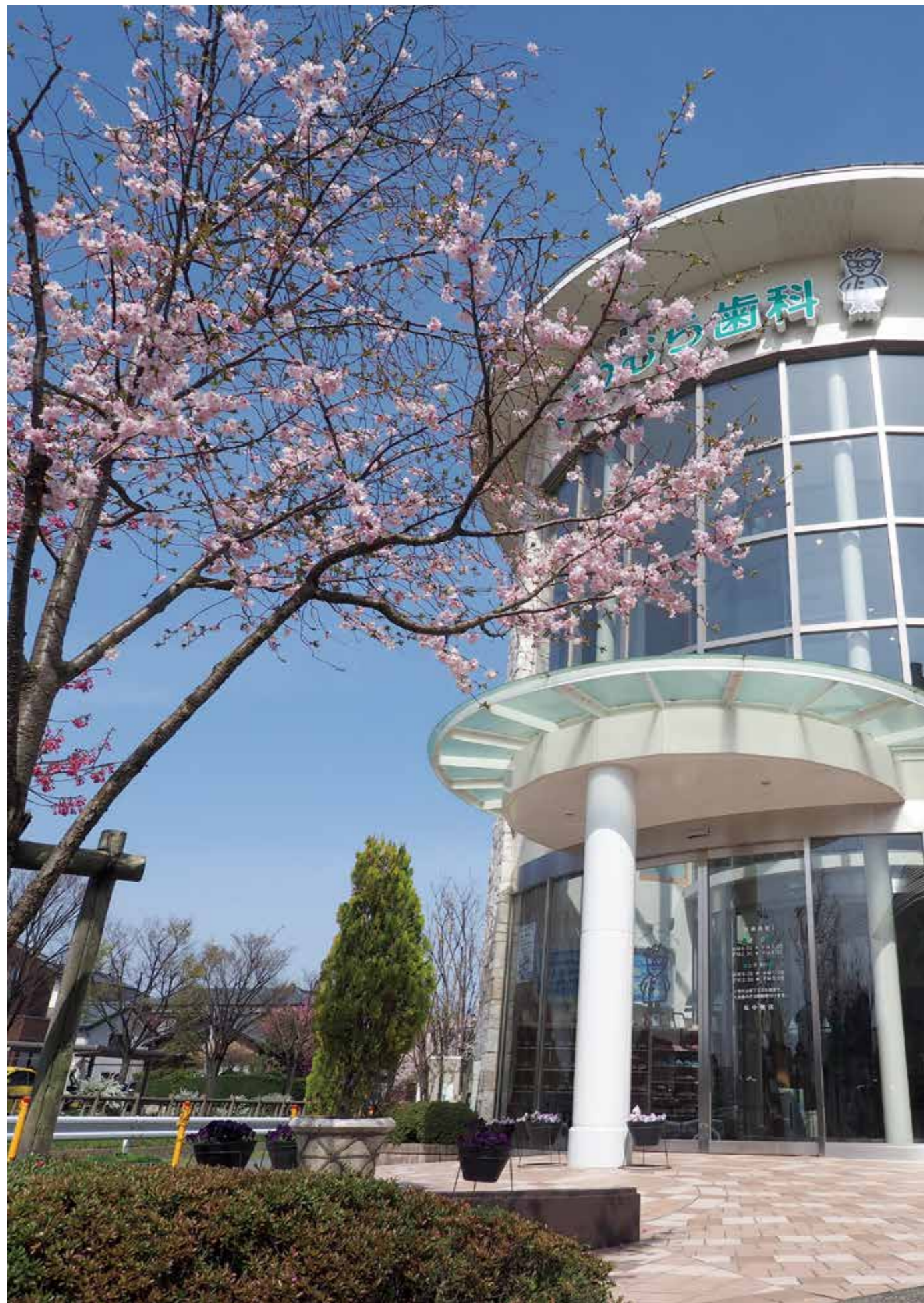
撮影場所：まつむら歯科 新津診療所