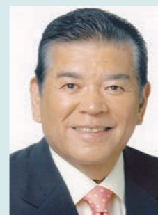
深谷 隆司 先生 元通産大臣 / 自民党東京都連最高顧問

1935年9月29日浅草生まれ 自民党東京都連最高顧問。TOKYO 自民党政経塾長。温故知新塾塾長。27歳で台東区議会議員に当選。33歳 都議会議員を経て、37歳で衆議院議員となる。当選9回。郵政大臣(第52代)、自治大臣(第47代)、国家公安委員会委員長(第57代)、通産産業大臣(第64代・65代)、自由民主党総務会長(第39代)、予算委員長、テロ対策特別委員長を歴任。